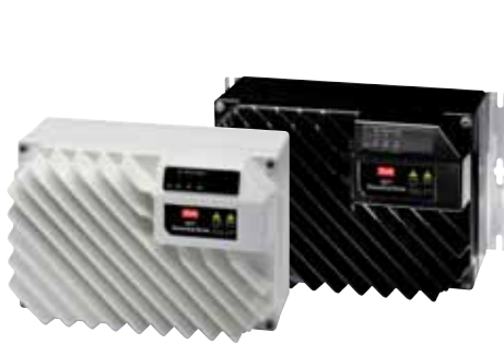
VLT® Decentral Drive FCD 302