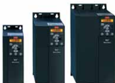
VLT® Micro Drive FC 51