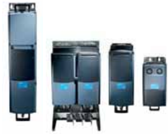
VACON® NXP Liquid Cooled Drive