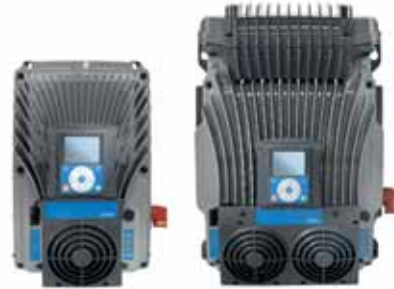
VACON® 100 X