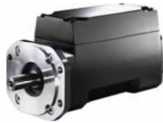
VLT® Integrated Servo Drive ISD 410 System