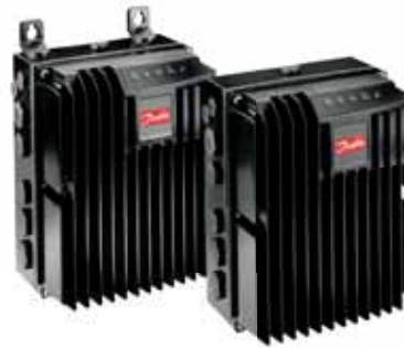
VLT® Decentral Drive FCD 300