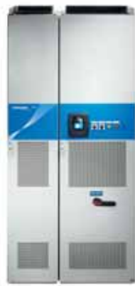
VACON® NXC Air Cooled Enclosed Drives