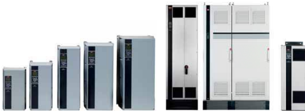
VLT® AutomationDrive FC 302, VLT® AQUA Drive FC 202 y VLT® HVAC Drive FC 102