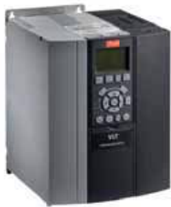
VLT® Lift Drive LD 302