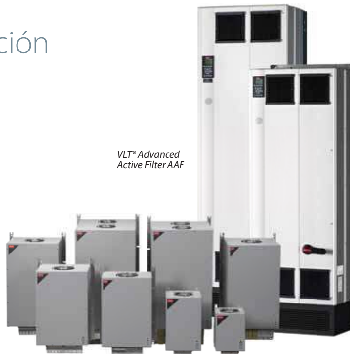
VLT® Advanced Active Filter AAF