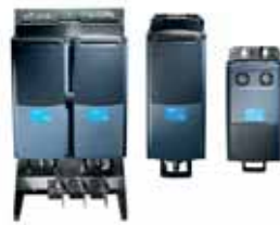
VACON® NXP Liquid Cooled Common DC Bus