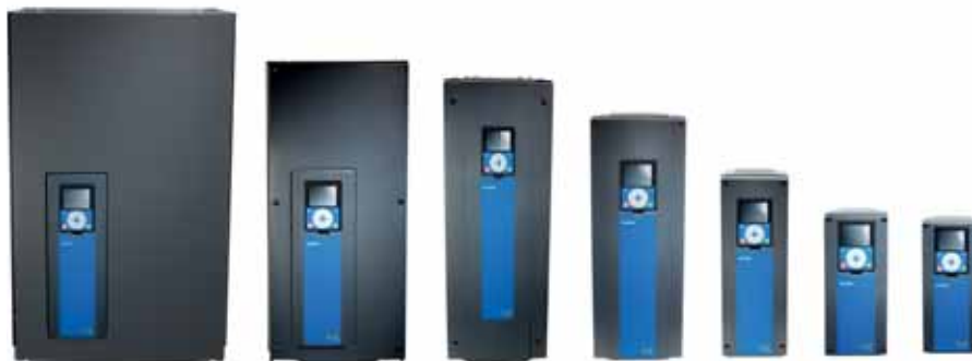
VACON® 100 INDUSTRIAL, VACON® 100 FLOW y VACON® 100 HVAC