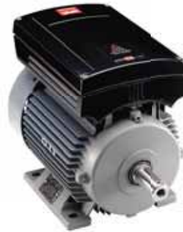
VLT® DriveMotor FCM 300