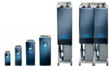
VACON® NXP Common DC Bus