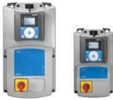
VACON® 20 X