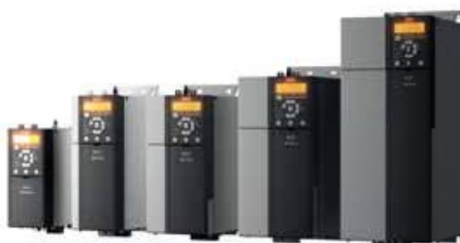
VLT® Midi Drive FC 280