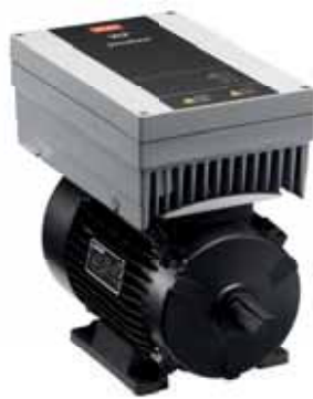
VLT® DriveMotor FCM 106