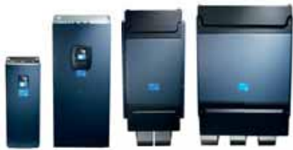
VACON® NXP Air Cooled