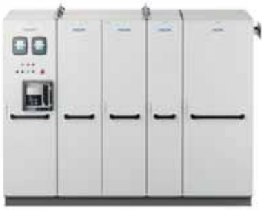
VACON® NXP Liquid Cooled Enclosed Drive